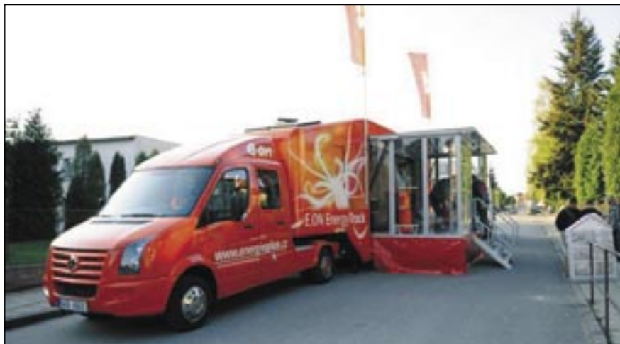
E.ON Energy Truck u školy ZŠ Batelov

Ovšem již nyní se ukázalo, že vrcholem nabízeného programu je Van de Graafův generátor, který dokáže za pomoci působení statické elektriny postavit vlasy