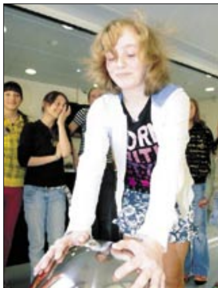
Van de Graafův generátor

Na stolním modelu krajiny, který byl zhotoven podle typicky českého rázu krajiny, je pomocí světelných řetězů a efektů znázorněno, jak se elektrina dostává z různých podob elektráren až do domácností. Stisknutím tlačítka se zobrazí průběh energetického řetězce – zde lze jako na dlaní spatřit, jak dlouhou cestu musí absolvovat elektrina a co všechno musí dodavatel elektrické energie E.ON zajistit, aby nám umožnil jednoduše stisknutím vypínače si ohřát ranní čaj a přivést do našeho života například světlo.